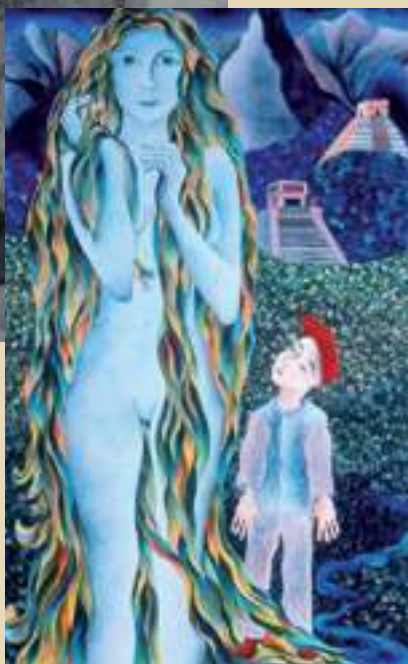
«Là où le temps s'arrête»