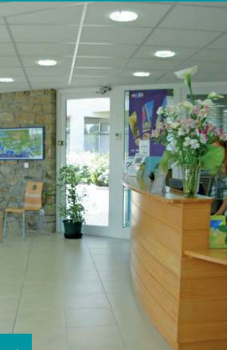
Office de Tourisme