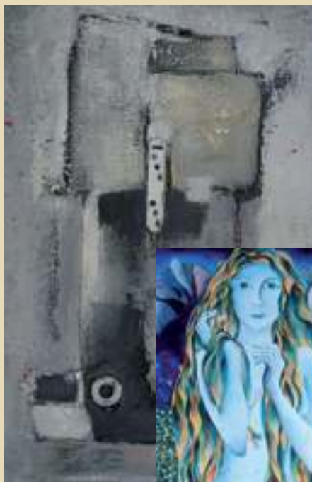
«Envie de couleur»