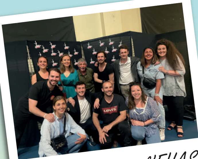
Les humoristes de l'EHAS