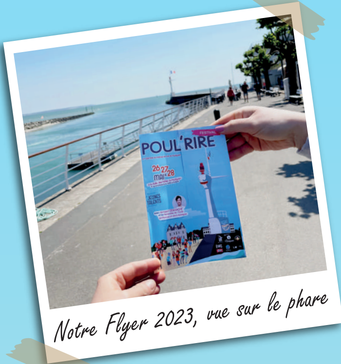
Notre Flyer 2023, vue sur le phare