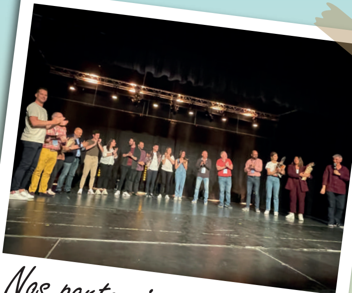
Nos partenaires sur scène !