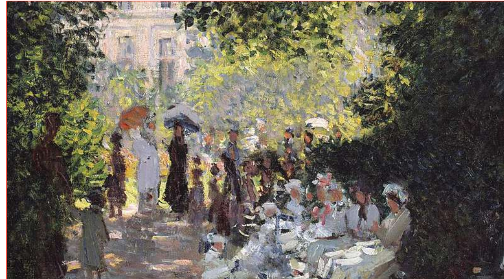
Le Parc Monceau, Claude Monet